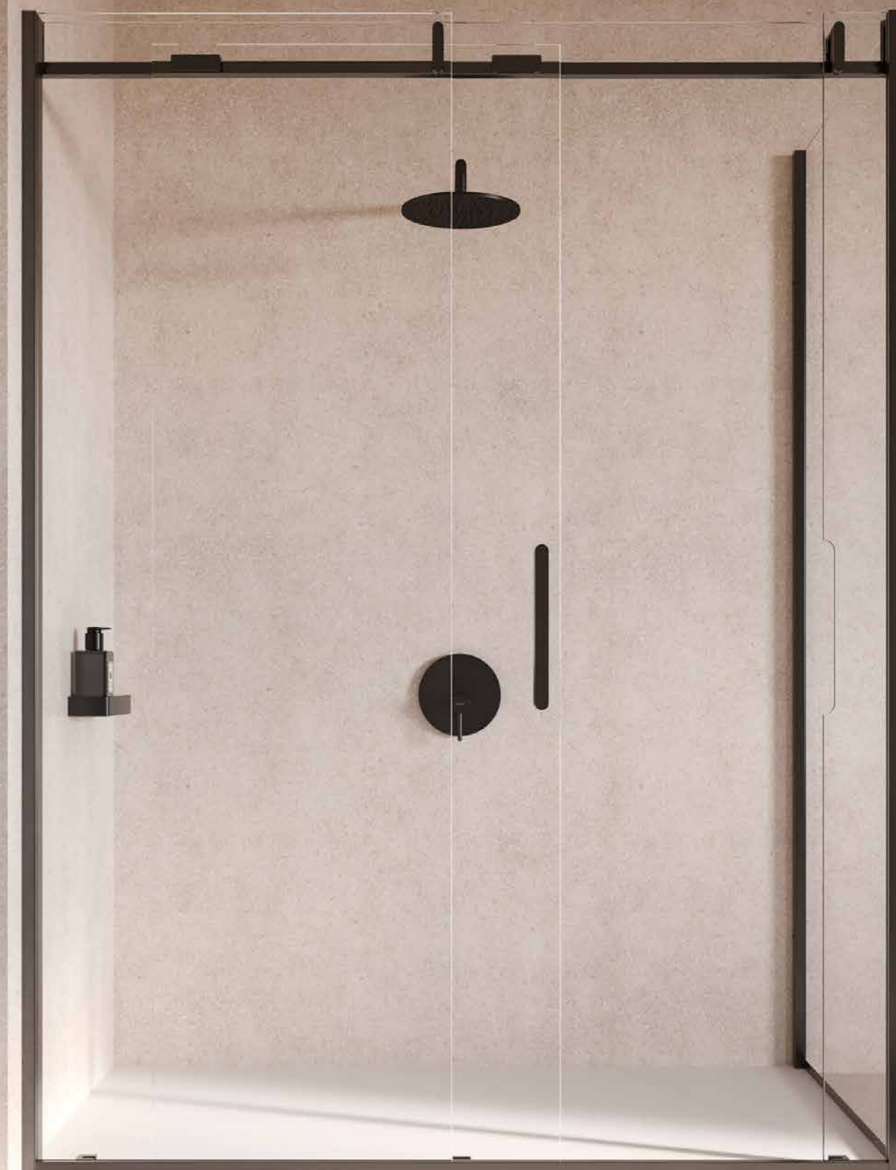
ALIDOS PORTA SCORREVOLE CON FISSO AD ANGOLO SLIDING DOOR WITH FIXED SIDE PORTE COULISSANTE AVEC CÔTÉ FIXE EN ANGLE

Le volume d'Alidos est harmonieux et équilibré grâce à l'équilibre parfait entre les surfaces transparentes et les éléments en acier inoxydable discrets. Le traverse supérieure est réalisée en verre en exploitant ses caractéristiques structurelles afin de maximiser la transparence et d'offrir une solution technique innovante et efficace. La poignée est presque invisible grâce au verre façonné qui l'accueille lors de sa fermeture. Alidos est disponible pour les compositions en niche et côté fixe en angle.