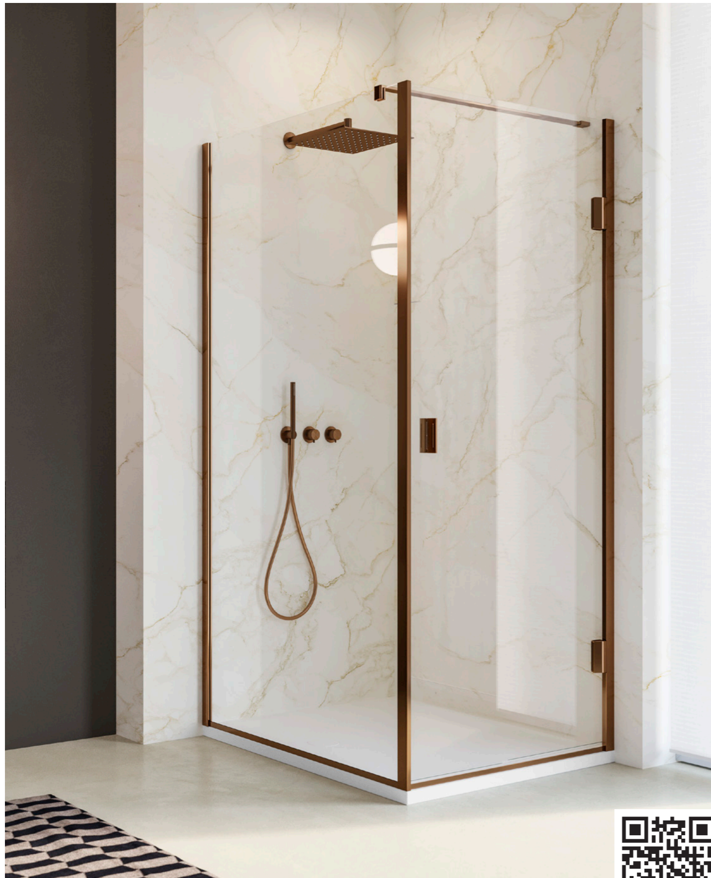
APERTURA CON ANTA BATTENTE. RAPPRESENTATA: SOLUZIONE AD ANGOLO, MODELLO SINISTRO CON POMOLO A SINISTRA LATO FISSO A SINISTRA, FINITURA ACCIAIO INOX PVD BRONZO SATINATO.