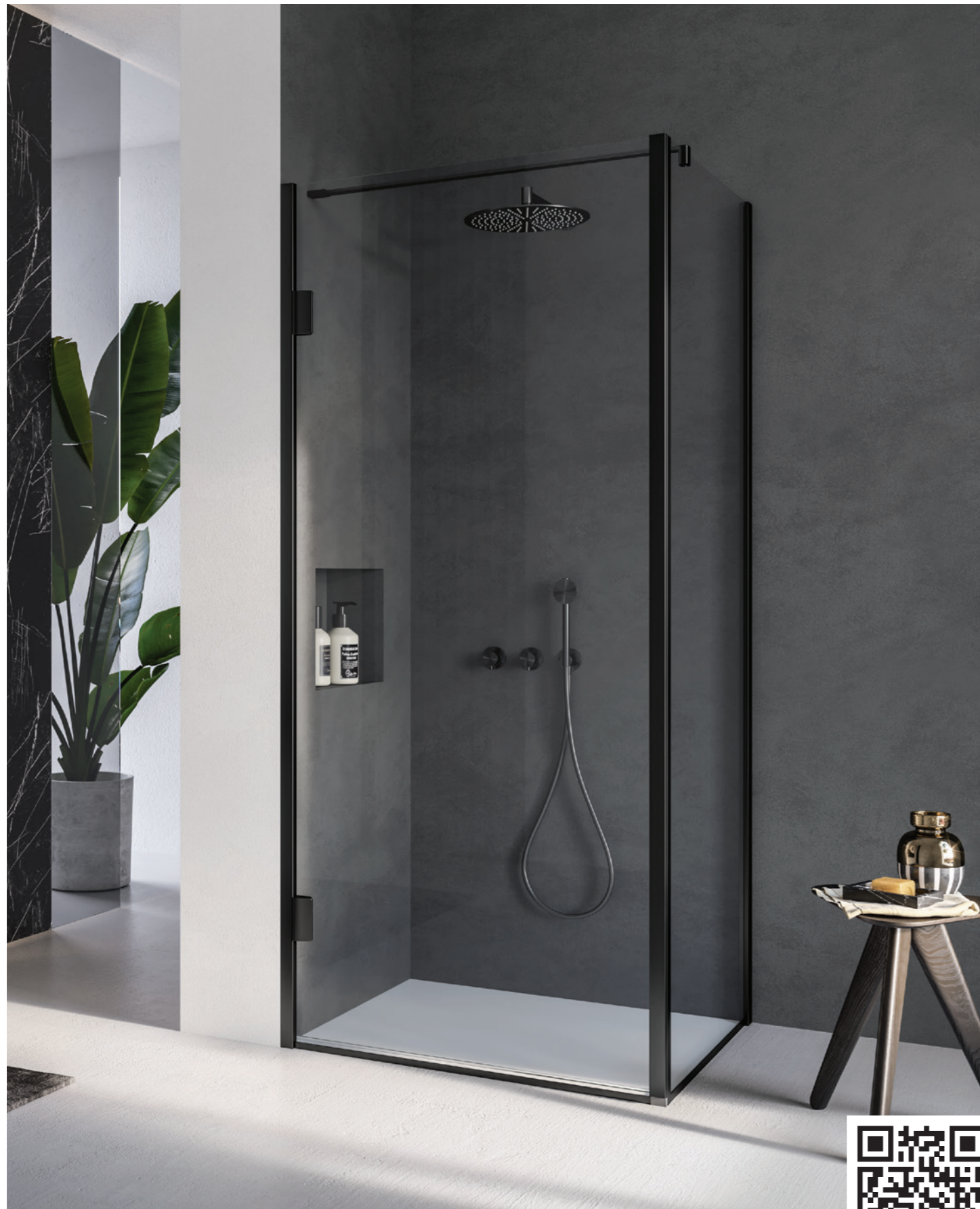
APERTURA CON ANTA BATTENTE. RAPPRESENTATA: SOLUZIONE AD ANGOLO, MODELLO DESTRO CON MANIGLIA INTEGRATA A DESTRA LATO FISSO A DESTRA, FINITURA ACCIAIO INOX PVD NERO SATINATO.