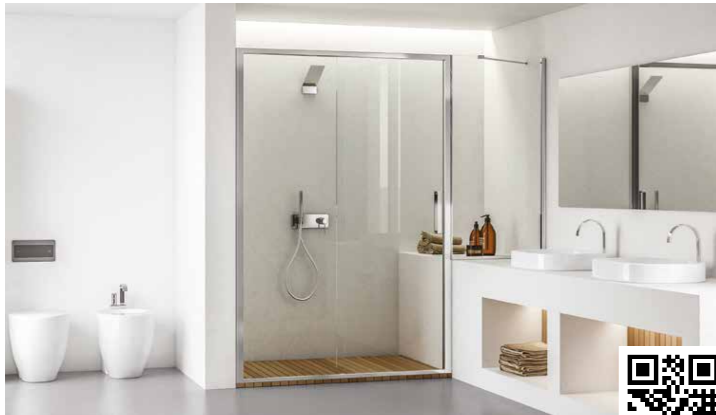
APERTURA CON ANTA SCORREVOLE. RAPPRESENTATA SOLUZIONE PER NICCHIA, MODELLO DESTRO (MANIGLIA A DESTRA) - SOPRAMURETTO IN LINEA A DESTRA.