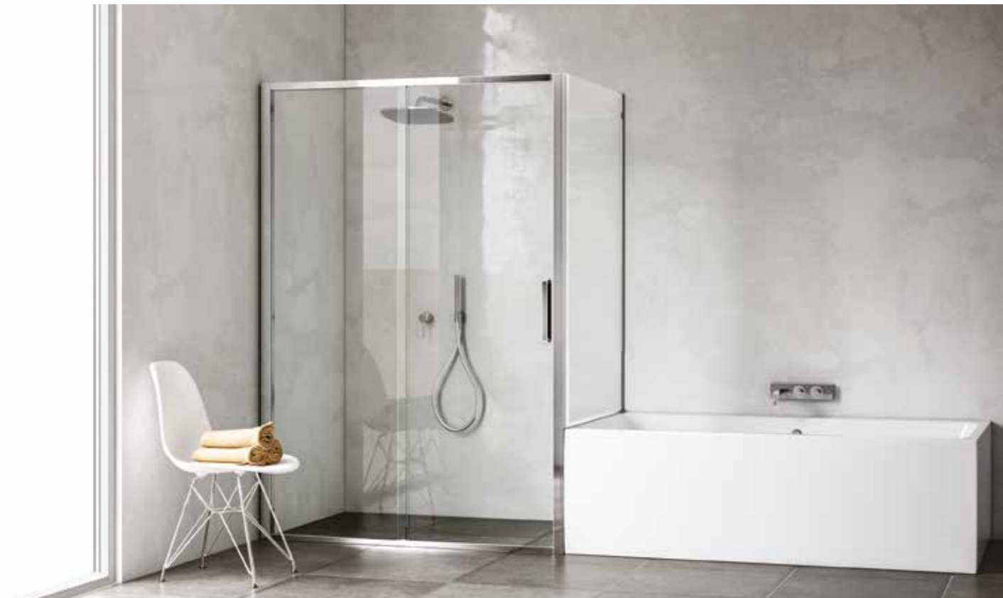
APERTURA CON ANTA SCORREVOLE. RAPPRESENTATA SOLUZIONE AD ANGOLO, MODELLO DESTRO (MANIGLIA A DESTRA) - SOPRAMURETTO AD ANGOLO A DESTRA.